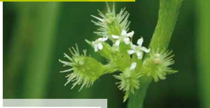
LE TORILIS NOUEUX ( Torilis nodosa )

De nombreux arbustes offrent de la nourriture aux passe-reaux (rouges-queues noirs ou à front blanc, mésanges, fauvelles...) qui nichent dans