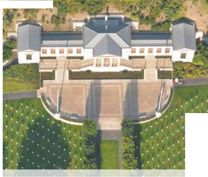
▲ Cimetière américain à Suresnes